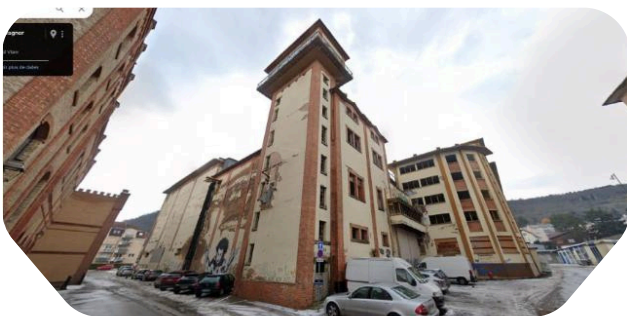
Friche brassicole de Mutzig - 68