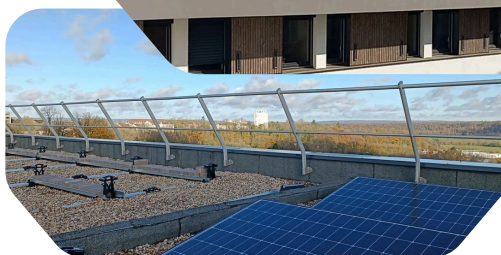
Rénovation du bâtiment administratif - DDT/ARS/VNF Chaumont - 52

A date, il est d'ores et déjà possible d'indiquer que ces réductions vont se poursuivre compte tenu des travaux réalisés dans l'année qui permettront de réduire les consommations lors de l'hiver 2025-2026, d'une utilisation plus efficace des installations suite à des expertises flash réalisées sur une diversité de bâtiments et aux recommandations faites aux gestionnaires, ou enfin, grâce à des challenges d'économie d'énergie lancés dans plusieurs services, qui reposent sur les comportements au quotidien des agents et les petits gestes qui, cumulés, produisent de grands effets.