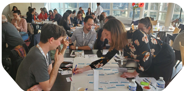
Rencontre Adaptation au Changement Climatique - Journée du 06/03 - 62 participants

Initier, déployer, renforcer ses projets