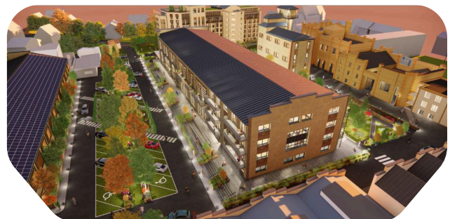
Projet de restauration de la friche de Mutzig - 68

La friche industrielle de l'ancienne brasserie de Mutzig (10 000 m 2 ), active de 1920 à 1989, fait l'objet d'un projet de reconversion soutenu par l'État via le Fonds vert (2,5 M€).