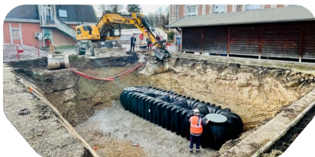
Récupération des eaux de pluie - Mise en place de cuves Préfecture du Haut-Rhin - Colmar - 68